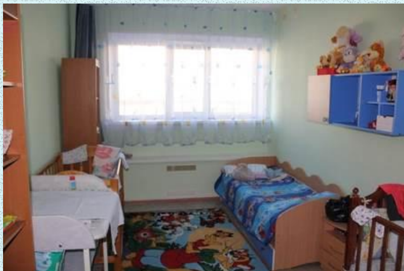
комната матери и ребенка