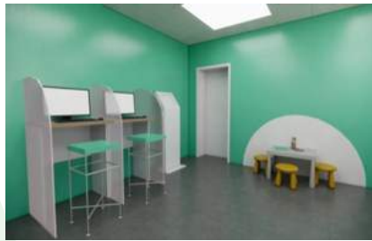
Зона цифровых сервисов